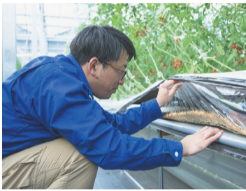
水ストレスで甘みをギュッ