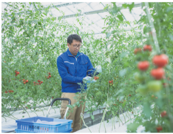
冬からゆっくり旨味を凝縮

この想いを私達は日々トマトづくりをしています。美味しいものを食べるとうれしい気持ちになる、誰かに教えたい、大切な人にも食べて欲しい。私達はそんな日常の中にある小さな幸せを届けたいと考えています。そんなトマトを作るために私達が取り組んだこと。それが「感動するほど美味しいトマト」を作り出す理由なのです。