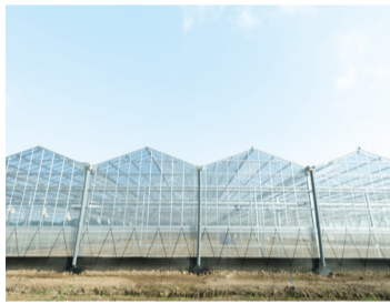
高性能オランダ式ハウス