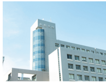
島根大学との共同研究